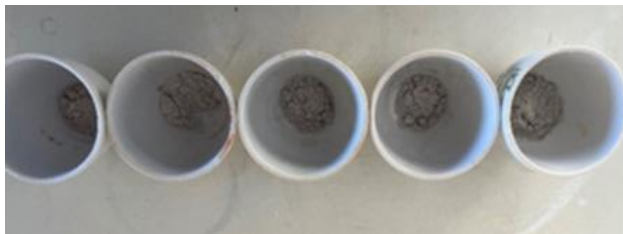
1. Φυτικοί ιστοί μετά την καύση