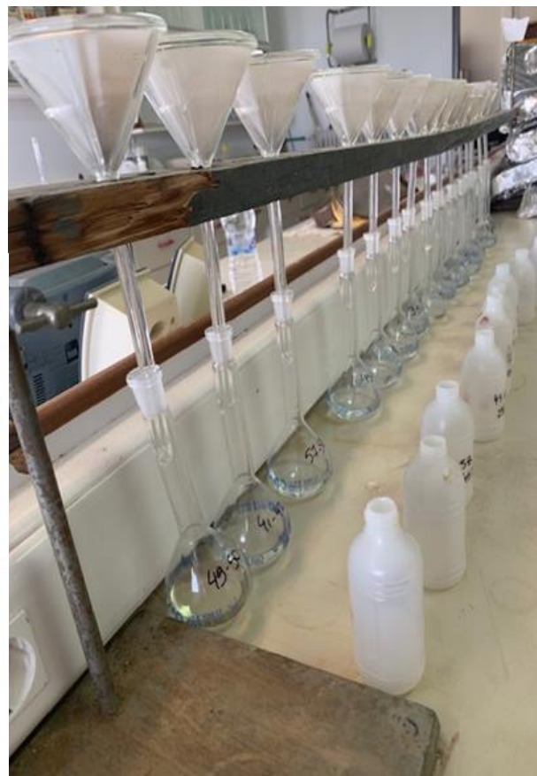
3. Διήθηση του διαλύματος των χωνευτηρίων σε χωνί με χάρτινο φίλτρο και συλλογή αρχικά σε γυάλινες φιάλες και μετά σε πλαστικά μπουκαλάκια των 100 ml (STOCK ΔΙΑΛΥΜΑ)