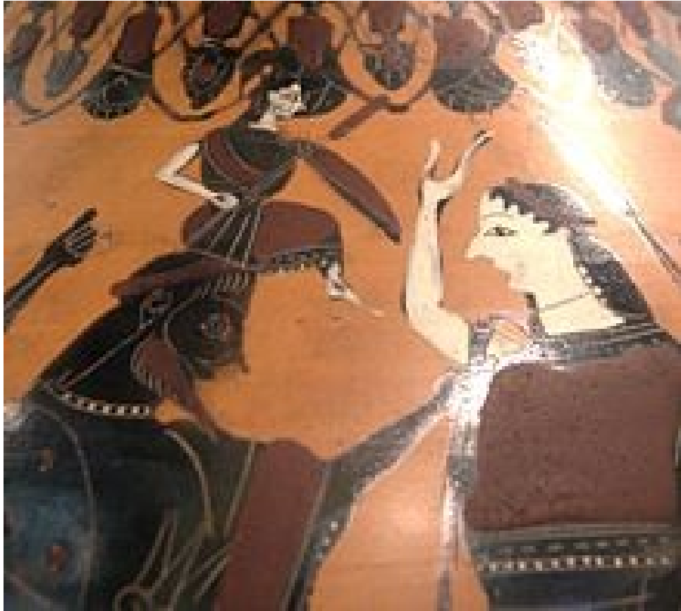
Η γέννηση της Αθηνάς από το κεφάλι του Δία, δεξιά πιθανώς Ειλείθια. Λεπτομέρεια από Αττικό μελανόμορφο αμφορέα, 550-525 π.Χ.)

Οι περί αυτής μύθοι ποικίλλουν, αν και πολλές φορές αντιφάσκουν. Ο Όμηρος πρώτος την αναφέρει ως "έφορο" του τοκετού, και της απελευθέρωσης της εγκύου, προστάτης θεά των επιτόκων. Κόρη του Δία και της Ήρας και αδελφή της Ήβης , του Άρη και του Ηφαίστου . Υπηρετεί την Ήρα αλλά δεν διστάζει όμως ν' απελευθερώσει τη Λητώ , παρά τη ρητή απαγόρευση της μητέρας της Ήρας, για να γεννηθούν ο Απόλλωνας και η Άρτεμη , καθώς και την Αλκμήνη για να γεννηθεί ο Ηρακλής .