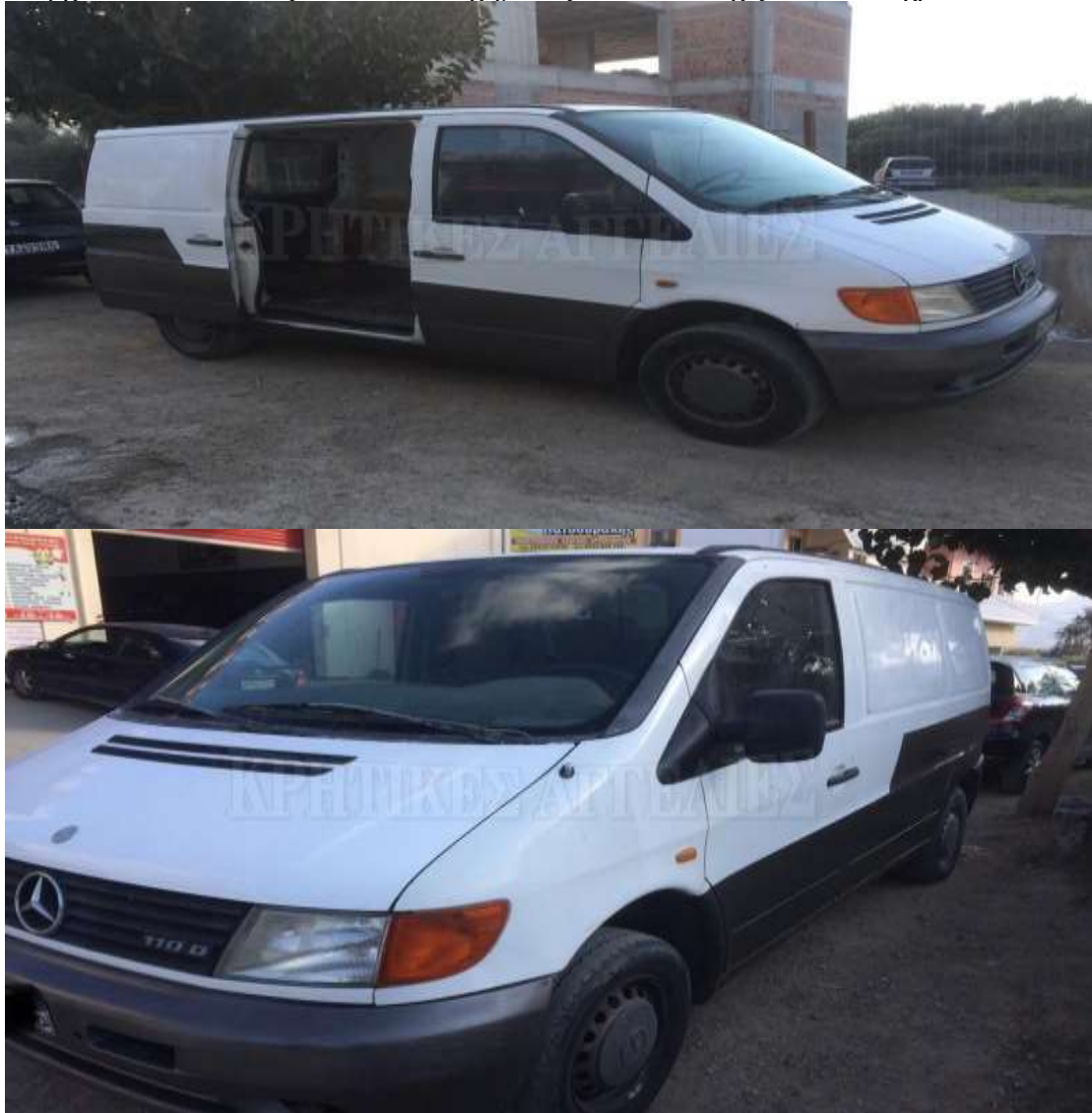
Εικόνα 2.Το όχημα της εταιρείας.

μεταφορά των αναγκαίων πρώτων υλών(π.χ τροφές).Το κόστος ανέρχεται στα 3700€.Θα υπάρχει και ένα κόστος service του οχήματος που θα στοιχίζει 500€ το χρόνο.