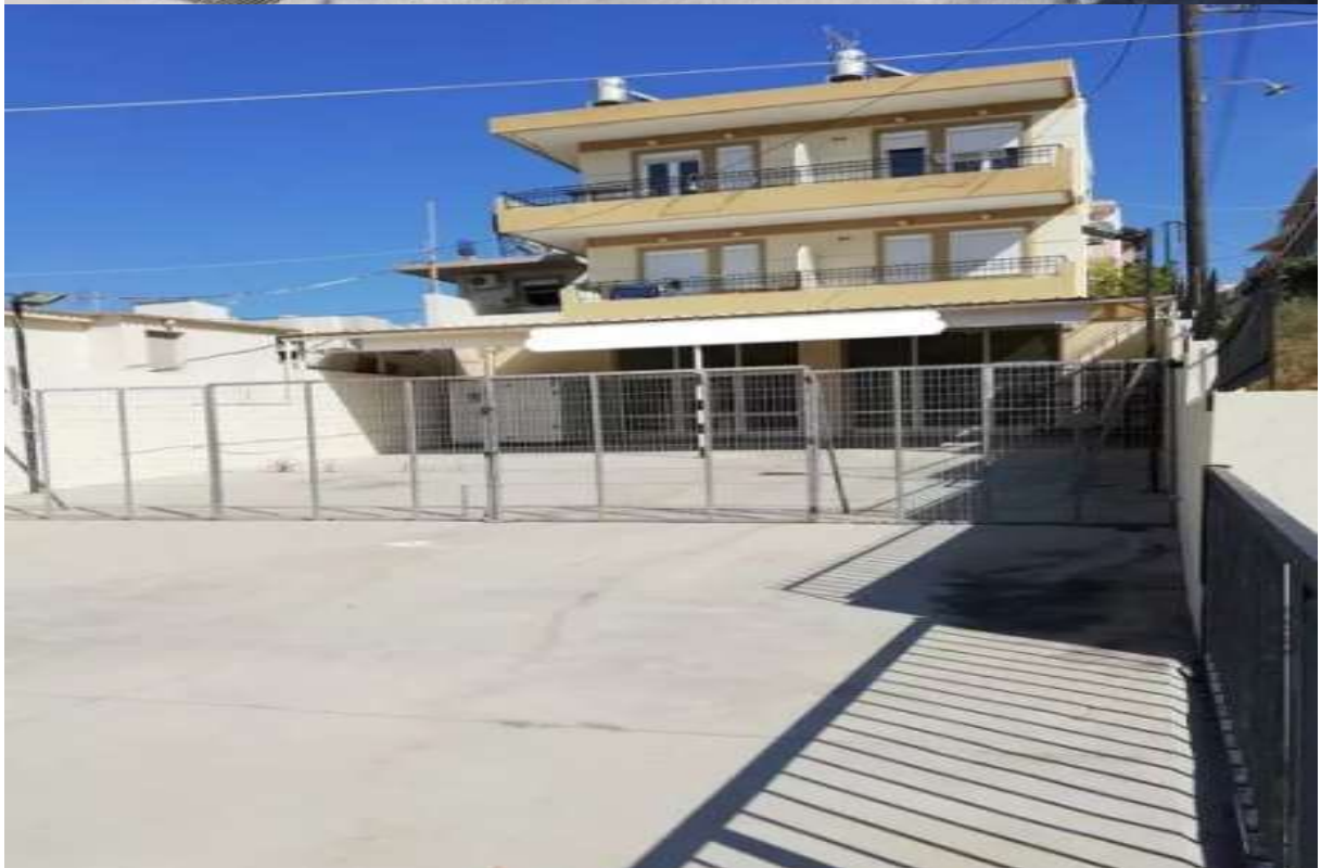
Εικόνα 1. Εγκαταστάσεις της επιχείρησης.