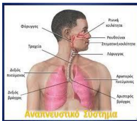
Εικόνα: Ανατομία αναπνευστικού συστήματος