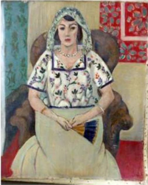
Henri Matisse, Η καθιστή γυναίκα , 1920 (Εκλάπη το 1941).