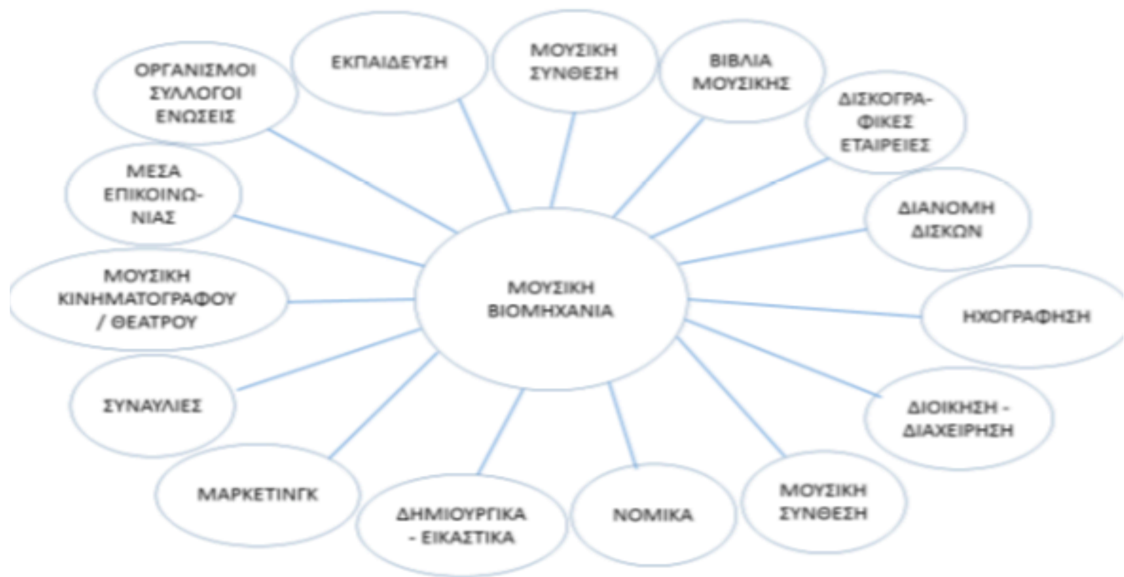
Σχήμα 1: Οι ευρύτερες επεκτάσεις της μουσικής βιομηχανίας