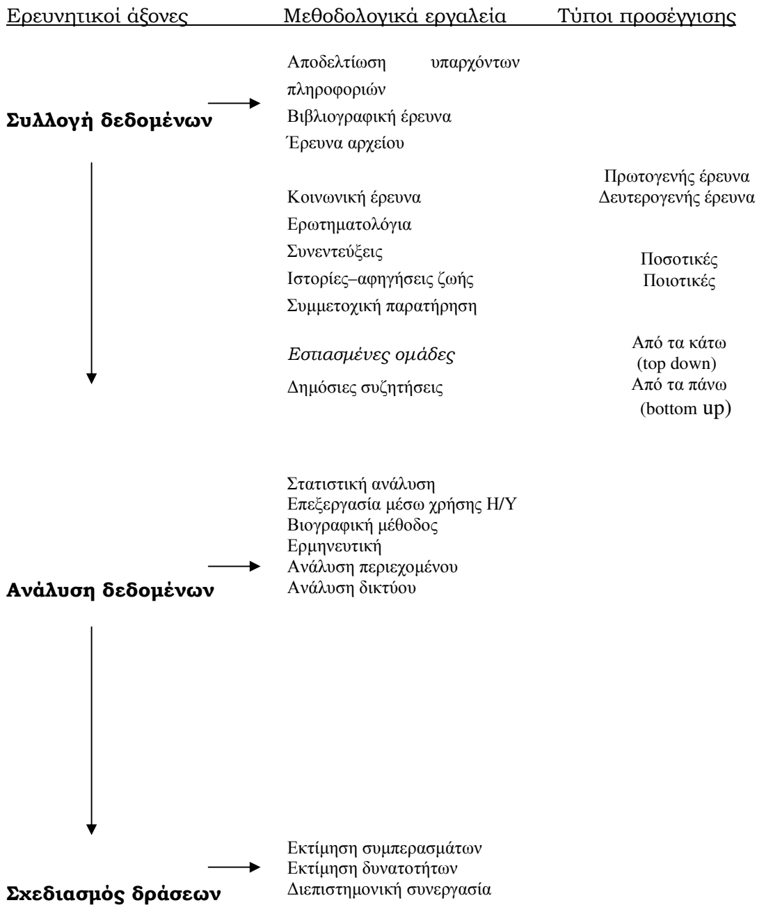
Διάγραμμα I: Ερευνητικοί άξονες, μεθοδολογικά εργαλεία και τύποι προσέγγισης στην Εκτίμηση Αναγκών και στις κοινοτικές έρευνες

Με βάση τον τύπο πληροφοριών που χρησιμοποιούμε διακρίνουμε τις δευτερογενείς και τις πρωτογενείς έρευνες. Οι δευτερογενείς έρευνες αφορούν τη